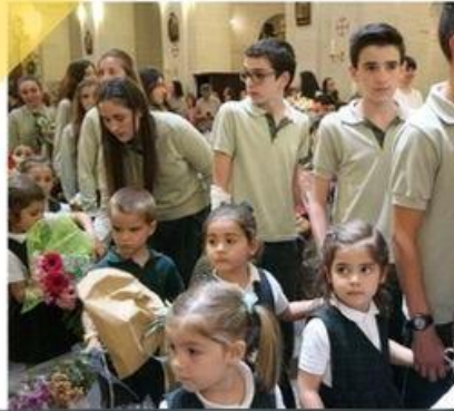
Visita a Nuestra Señora Patrona