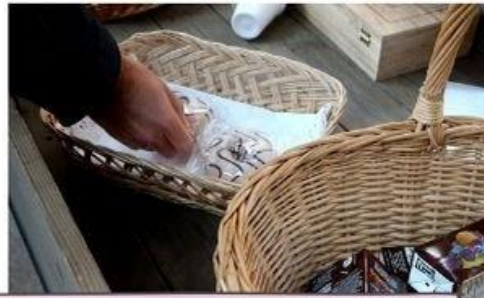
Proyecto Solidario "Fundación Antonia Colado"