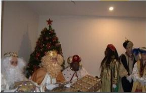
Cabalgata de los Reyes Magos