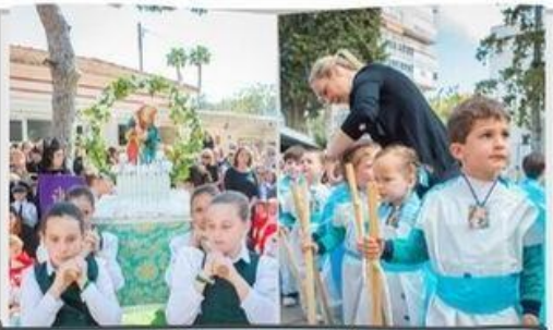
Procesión Semana Santa