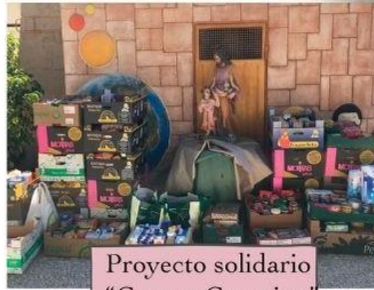
Proyecto solidario "Cuenta Conmigo"